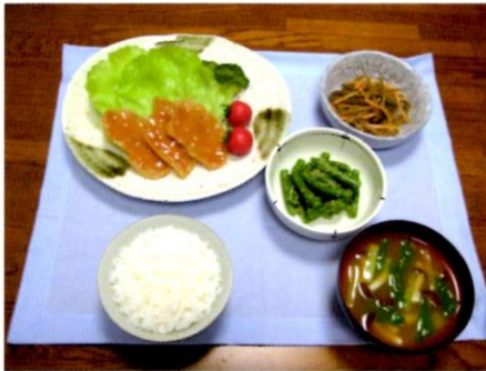
▲ フードモデルを使って、わかりやすく説明します。