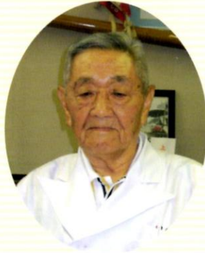
医療法人 団仲会 奥島病院 名誉院長