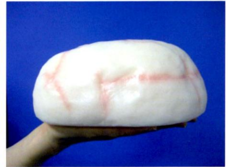
▲ これが、1kgの脂肪！（模型）